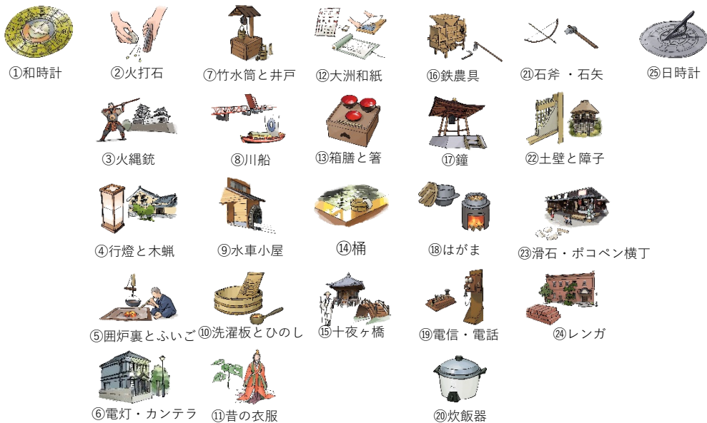
時を刻む道具たち