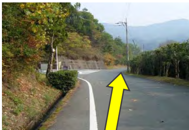
1 当所から下り 最初の三叉路を直進