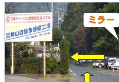
7 「神山自動車整備工場」 の看板が見えたら減速 右側のミラーの位置で 左折