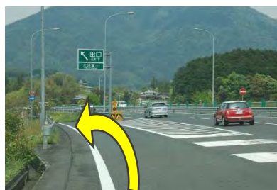
4 最初の大洲脇南出口で 自動車道路を降りる (大洲自動車道は無料)