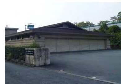
9 左側に カヌー研修センター