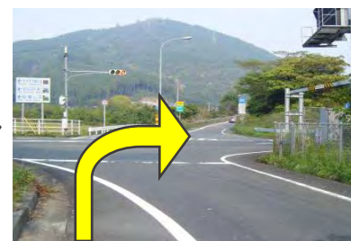
5 最初の信号を右折