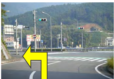
2 出発して、 約1.4kmで国道56号左折