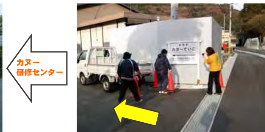
8 小道に進入し直進30mで カヌー研修センター