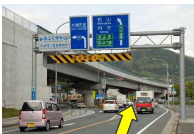
3 最初の信号を直進し 大洲自動車道路に進入