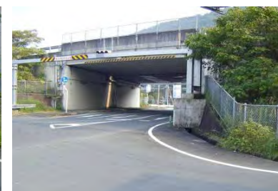
大洲自動車道の高架下を 直進