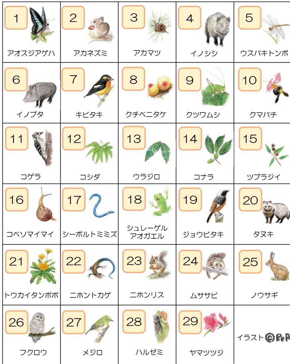
イラスト © R&P