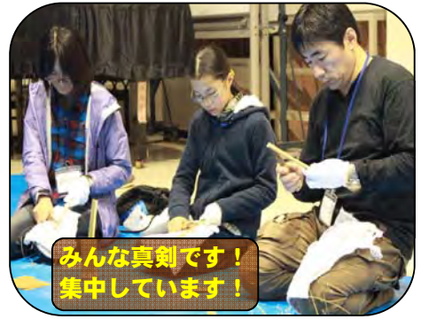
みんな真剣です！ 集中しています！