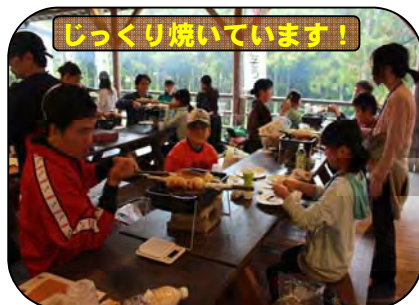
じっくり焼いています!