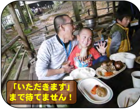
「いただきます」 まで待てません！