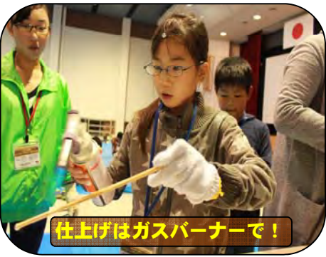
仕上げはガスバーナーで！