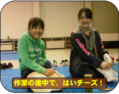
作業の途中で、はいチーズ！