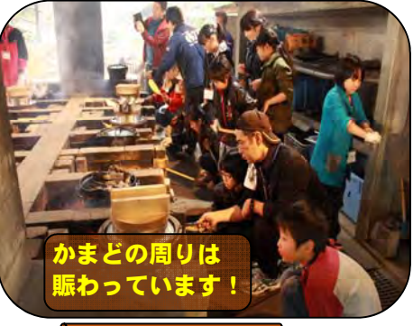
かまどの周りは 賑わっています！