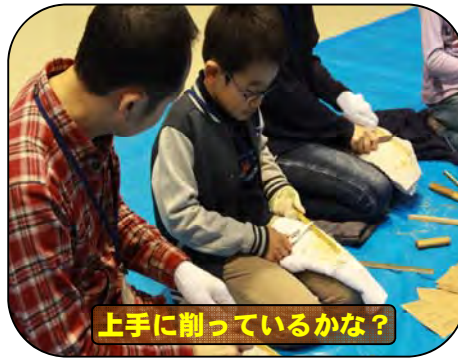
上手に削っているかな？