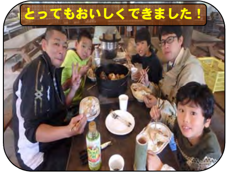
とってもおいしくできました！