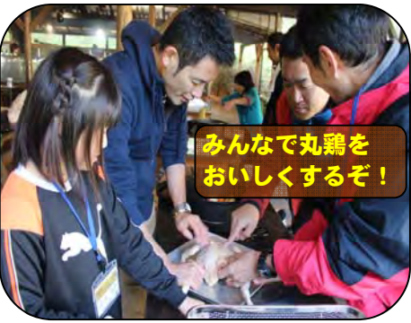
みんなで丸鶏を おいしくするぞ！