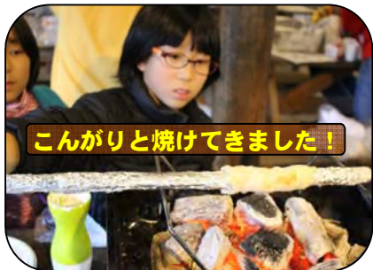
こんがり焼けてきました!