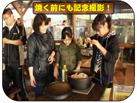
焼く前にも記念撮影！