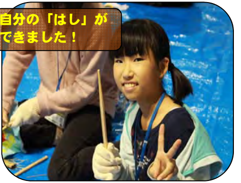
自分の「はし」が できました！