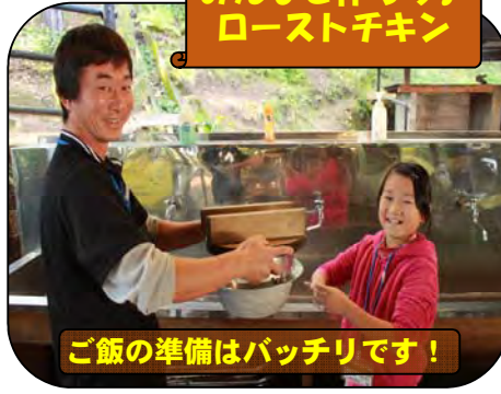
ご飯の準備はバッチリです！