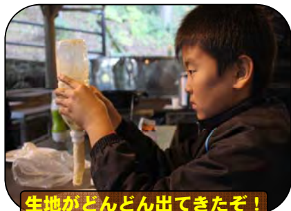
生地がどんどん出てきたぞ!

「ふれあいアウトドア体験 秋編」は、「食欲の秋を満喫」をテーマにして、野外炊飯を中心に1泊2日の事業を2回実施した。1日目は、「振って作ろう♪」を合い言葉に、竹巻きパン作りを実施した。最初にペットボトルの中にパンの材料を入れ、振り混ぜて生地を作っていた。参加者は、発酵した生地がペットボトルから自然と出てくる様子に驚いていた。また、炭火でじっくりと焼いたパンに、生クリームを振って作ったバターを付けて食べ、大変満足した様子であった。夜は、竹を削って作るはし作りを行った。参加者は、小刀の安全な使い方を覚え、集中してはし作りに取り組む姿が印象的であった。2日目は、丸鶏を使ったローストチキン作りを行った。ほとんどの参加者は丸鶏を触ることやダッチオーブンを使うことが初めてであったが、どの班もおいしく調理できていた。普段できない体験を味わうことができた。