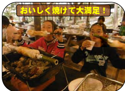
おいしく焼けて大満足!