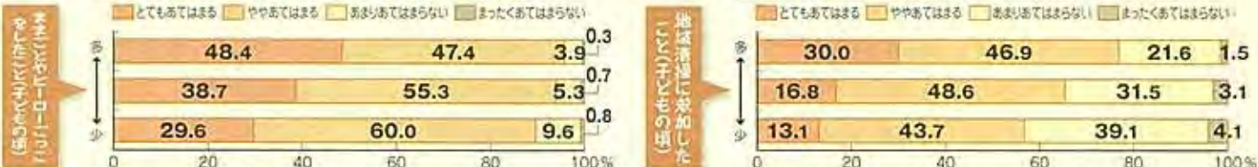
出典「子どもの体験活動の実態に関する調査研究」国立青少年教育振興機構 平成22年

「自然の中で遊んだことや自然観察をしたことがある」と回答している子どもの方が、学力調査の平均正答率が高い傾向にあります。