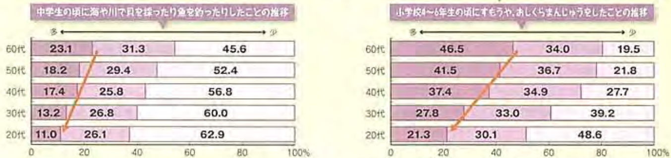
出典「子どもの体験活動の実態に関する調査研究」国立青少年教育振興機構 平成22年

子どもたちが、自然のなかや、友だちと遊ぶなどといった体験の機会が減少しています。